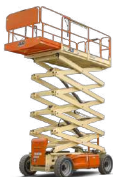
PIATTAFORMA AEREA VERTICALE ELETTRICA 12 M.T.