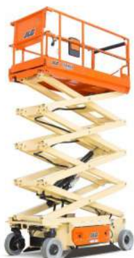
PIATTAFORMA AEREA VERTICALE ELETTRICA 10 M.T.