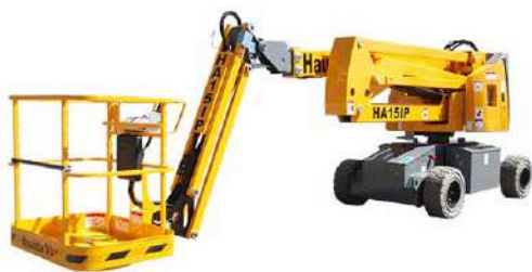
PIATTAFORMA AEREA ELETTRICA