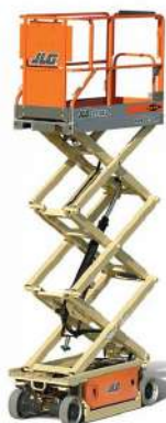
PIATTAFORMA AEREA VERTICALE ELETTRICA 6 M.T.