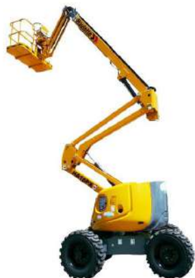
PIATTAFROMA AEREA DIESEL