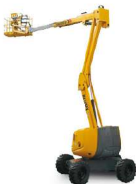
PIATTAFORMA AEREA DIESEL