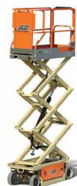
PIATTAFORMA AEREA VERTICALE ELETTRICA 8 M.T.