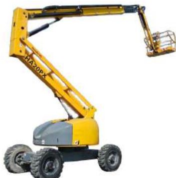
PIATTAFORMA AEREA DIESEL